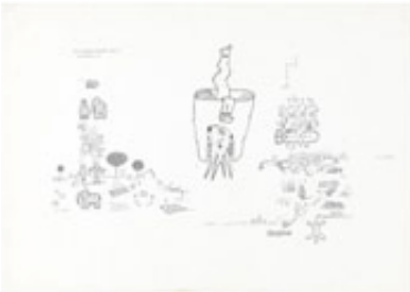
Gianfranco Baruchello Untitled , 1993 Tusche auf Karton 36 x 50,7 cm