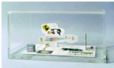
Gianfranco Baruchello Tipica facies , 1974 Verschiedene Materialien in Plexiglas 22 x 31,5 x 16 cm