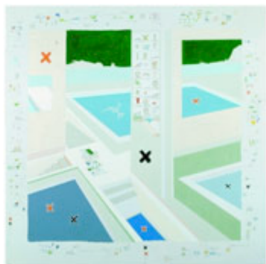
Gianfranco Baruchello Acrobata clandestine , 1988 Öl auf Leinwand 200 x 600 cm

Gerät irgendwo zwischen Laboranlage und Samowar, die Teetasse steht schon bereit. Das geht so lange, bis man selbst bei Pflanzen, ausgestreckten Zungen und abgetrennten Fingern, die hier als Partialobjekte auf der Leinwand verteilt sind, sofort an eindrucksvoll wuchtige Gemächte denken muss. Aber auch das weibliche Geschlecht ist im Angebot, so scheint es zumindest, in Form von rudimentären und ebenfalls immer mal wieder ins Pflanzliche gemorphten Anatomiezeichnungen, die alles bis hin zur Gebärmutter im Querschnittsprinzip freilegen. Der biologische Schoss der Menschheit, eine Zwiebel. Nebenan erheben sich zwei wohlgeformte Gesäßberge.