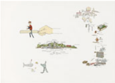
Gianfranco Baruchello Témoigner du différend , 1983 Emaillack auf Karton 36 x 50,7 cm