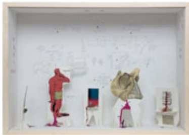
Gianfranco Baruchello Finirà come Cola , 2009 Verschiedene Materialien in Holzrahmen und Plexiglas 70 x 50 x 16 cm