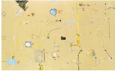
Gianfranco Baruchello Être, in, avec, mentre , 1963 Bleistift und verschiedene Materialien auf Papier auf Leinwand 140 x 230 cm