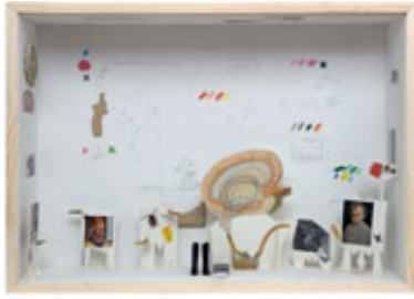
Gianfranco Baruchello Non dice, non nasconde, accenna , 2009 Verschiedene Materialien in Holzrahmen und Plexiglas 70 x 50 x 16 cm Courtesy of Galerie Michael Janssen, Berlin

Courtesy of Galerie Michael Janssen, Berlin